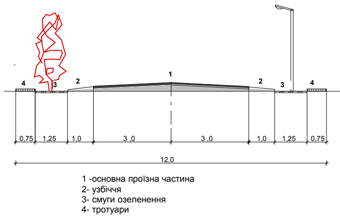
Поперечний профіль вулиці

ПОГОДЖЕНО Начальник відділу містобудування та архітектури -головний архітектор